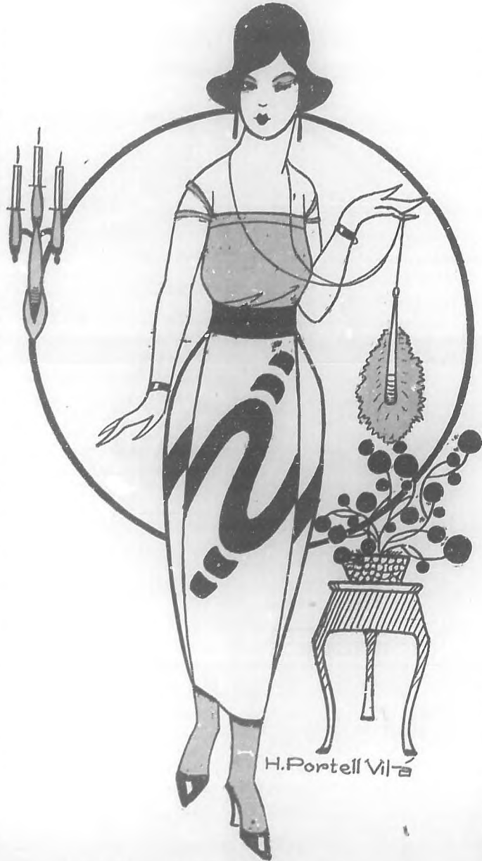
La misión de la mujer en la existencia es esperar; esperar indefinidamente.

Cuando se tienen veinte años, la última pasión es la que se cree definitiva. Pero luego, a medida que el tiempo transcurre se ve con asombro que el llegar a la reconquista de la paz, por el vicieuto tortuoso del olvido, no es tan difícil ni tan imposible, como al principio se creía. Y es que a esa edad, señorita "Apasionata" vivimos nuestra vida en anhelo abierto a la Quimera. A esa edad, la de los ensueños azules, la pasión bien correspondida, sin complicaciones y sin pequeños dolores, no nos satisface. Vemos la felicidad a través del prisma engañoso del romanticismo. Y de ahí el que ustedes las mujeres sueñen al amante a la manera de Romeo, venciendo obstáculos, en tanto que nosotros los hombres, convertimos a la novia en ingrata malgre lui, sólo para poder cantarle como Petrarca cantó a Laura o Acuña cantó a Rosario. En el fondo de su asunto, no hay más que eso, idealismo por (Pasa a la Pág. 20.)