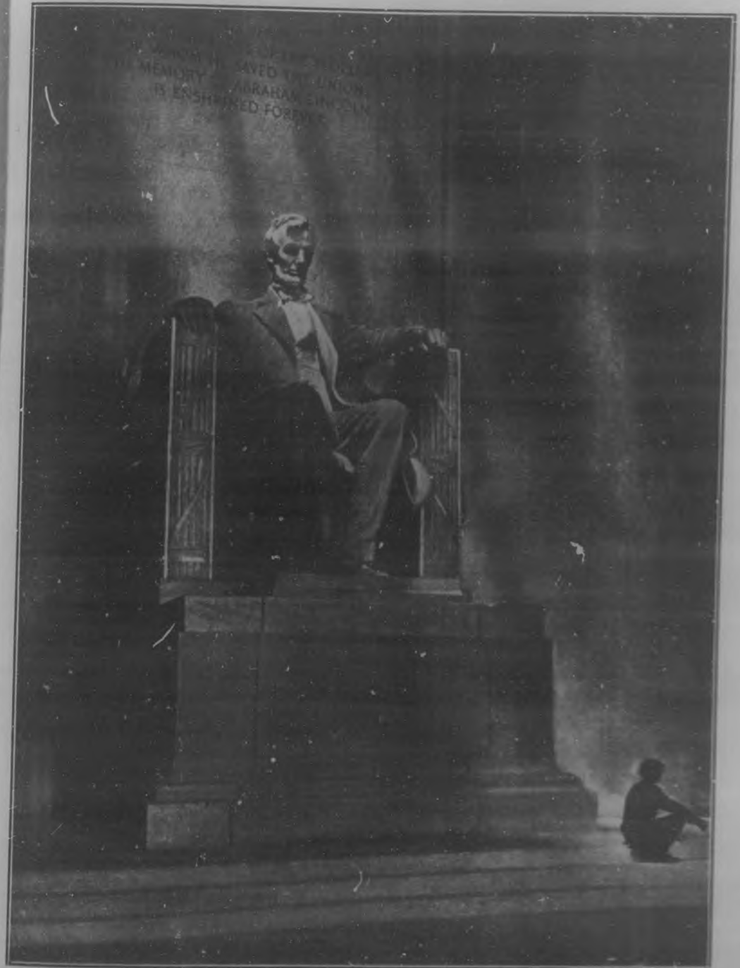
La grandiosa estatua a Abraham Lincoln, recientemente inaugurada en Washington y que fué donada a la nación americana por el Estado de Virginia. La estatua es obra del famoso escultor americano Daniel Chester French.

Redacción, Administración y Talleres: Edificio de BOHEMIA, Tronador número 40, 41 y 42. Teléfonos: Dirección, M-1221; Administración, A-1222; Edificio, M-1228.